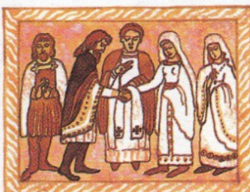
5. musí být posvěceno knězem a člověk je nemůže ze své vůle rozloučit