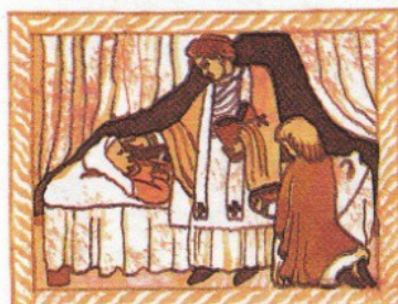
4. udílí kněz umírajícímu na znamení odpuštění jeho hříchů