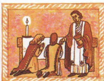
2. připomíná poslední večeři Ježíše s učedníky