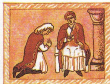
3. slib nápravy a modlitby - nařizuje kněz po zpovědi