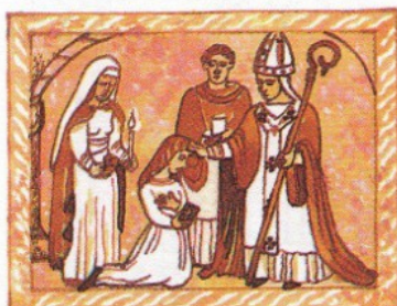
1. potvrzuje vstup člověka do křesťanské církve

Úkol č. 7 Obrázky představují některé z křesťanských svátostí. S pomocí nabídky je urči